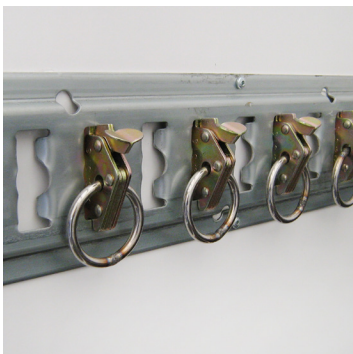
Uitgebreid aanbod in ladingszekeringen