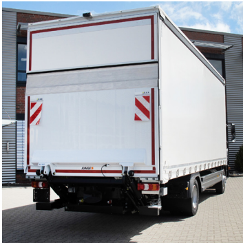
Uitvoering in schuifzeil