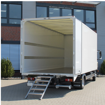
Dubbele achterdeuren icm uitschuifbare trap.